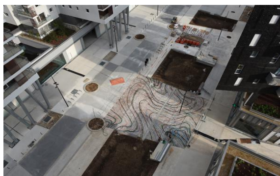
La vue aérienne du traçage Marbre d'ici