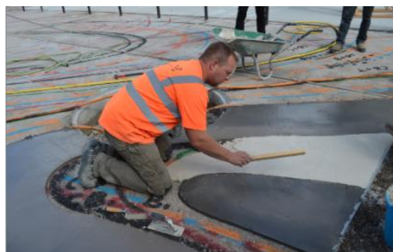
Le coulage du Marbre d'ici